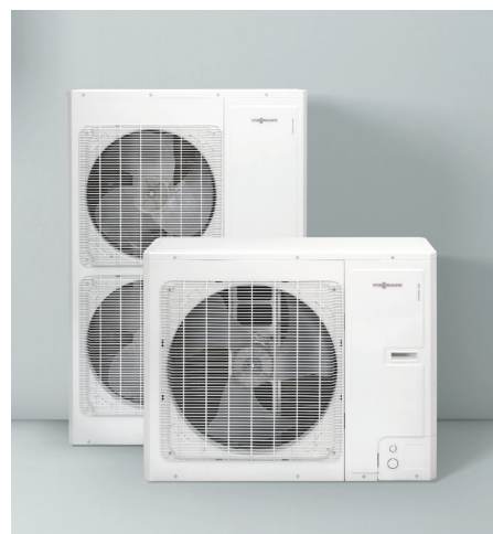
Vitocal 100-S Зовнішній блок

Регулятор Vitotronic 200 дозволяє ефективно використовувати тепловий насос не тільки в нових системах, а і при модернізації